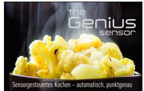
Sensorgesteuertes Kochen – automatisch, punktgenau