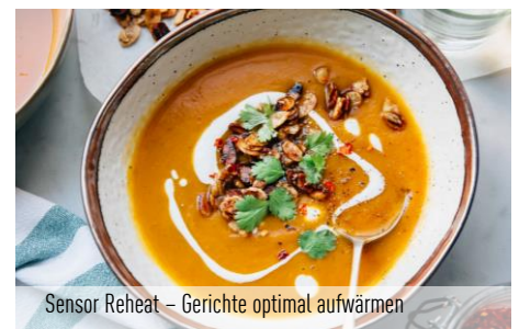
Sensor Reheat – Gerichte optimal aufwärmen