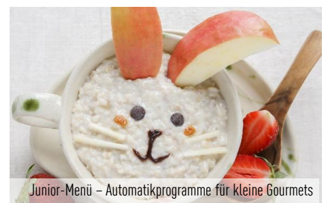
Junior-Menü – Automatikprogramme für kleine Gourmets

Mit der neuen Solo-Mikrowelle bereiten Sie Gerichte clever und besonders appetitlich zu. Dabei helfen sensorgesteuerte Automatikprogramme bei der punktgenauen Zubereitung – ohne weiteres Zutun. Die Sensor Reheat Funktion unterstützt den schnelllebigen Alltag mit ihrer Aufwärmfunktion auf Knopfdruck. Praktische Funktionen wie Schnellstart zum Einstellen der Garzeit in 30-Sekunden-Schritten und ZeitPlus für eine Verlängerung der Garzeit während des Kochvorgangs runden die Programmvierfalt der Solo-Mikrowelle mit Inverter-Technologie ab.