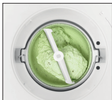
Sahneeiscreme in nur ca. 30 Minuten