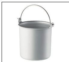
Entnehmbarer, eloxierter Eisbehälter